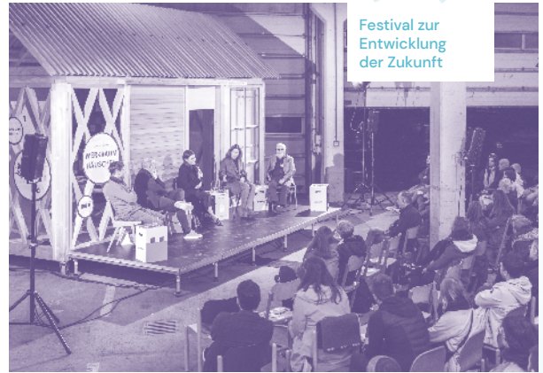
Festival zur Entwicklung der Zukunft